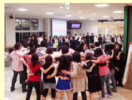
「慶早戦前夜祭」若き血合唱