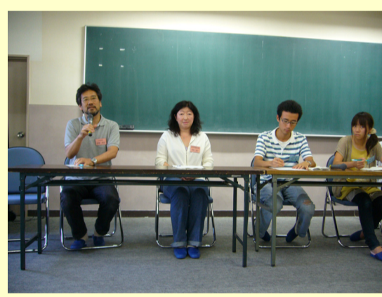
教員・職員・上級生による座談会