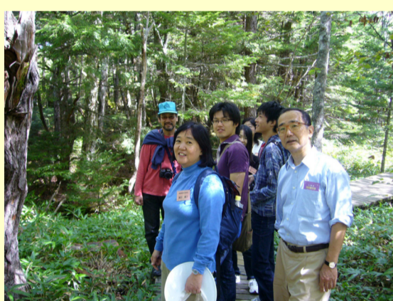
教職員と語りながら自然散策