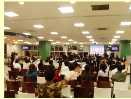
「慶早戦前夜祭」応援指導