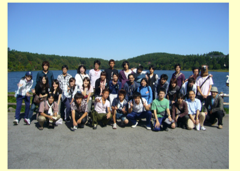
「塾生交流in立科」女神湖にて