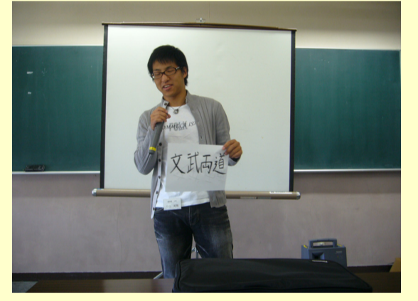
全員が大学生生活の抱負を発表