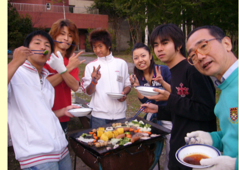
「塾生交流in立科」バーベキュー