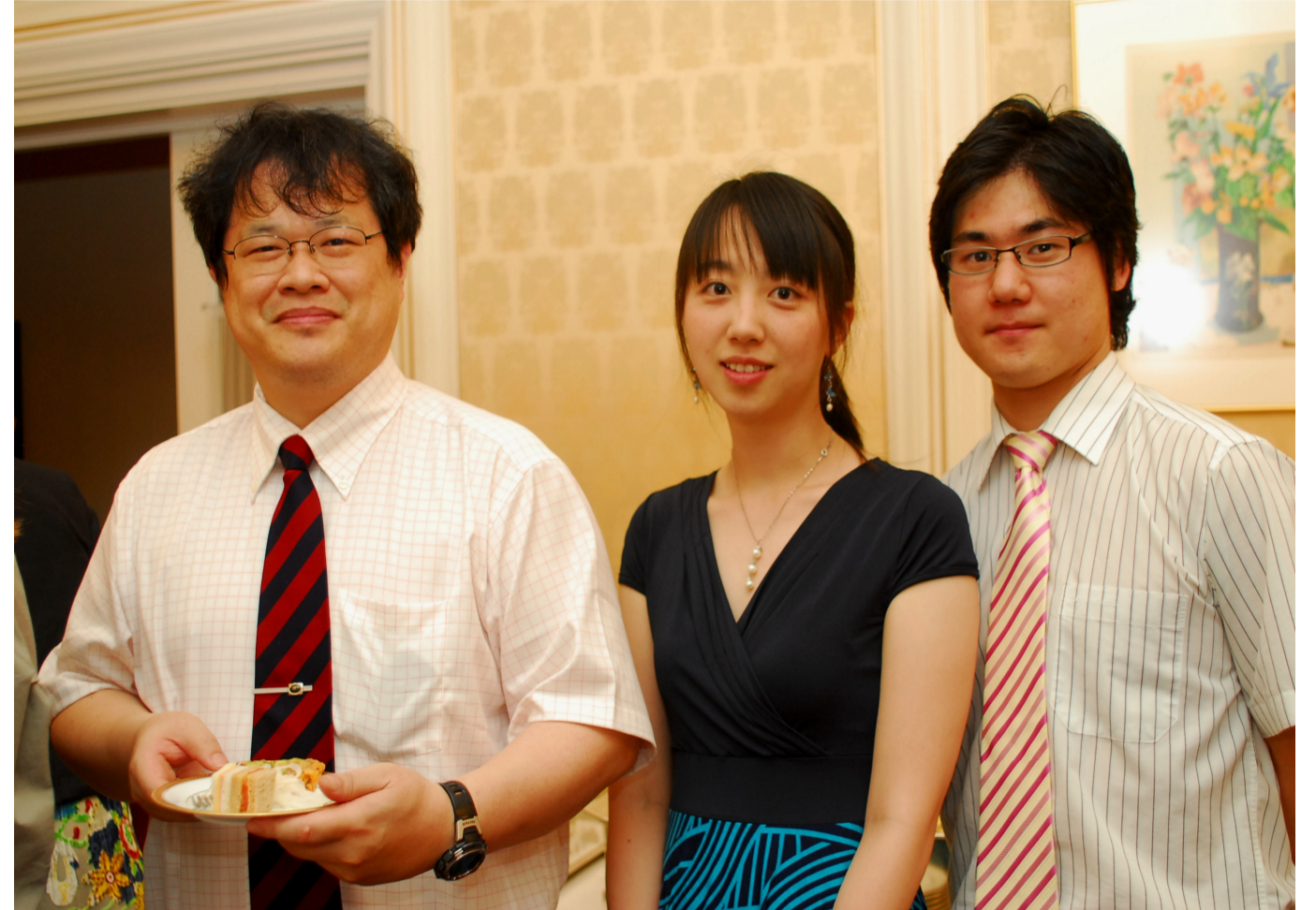
7月 亜州大学と学部間協定締結 研修生受け入れ