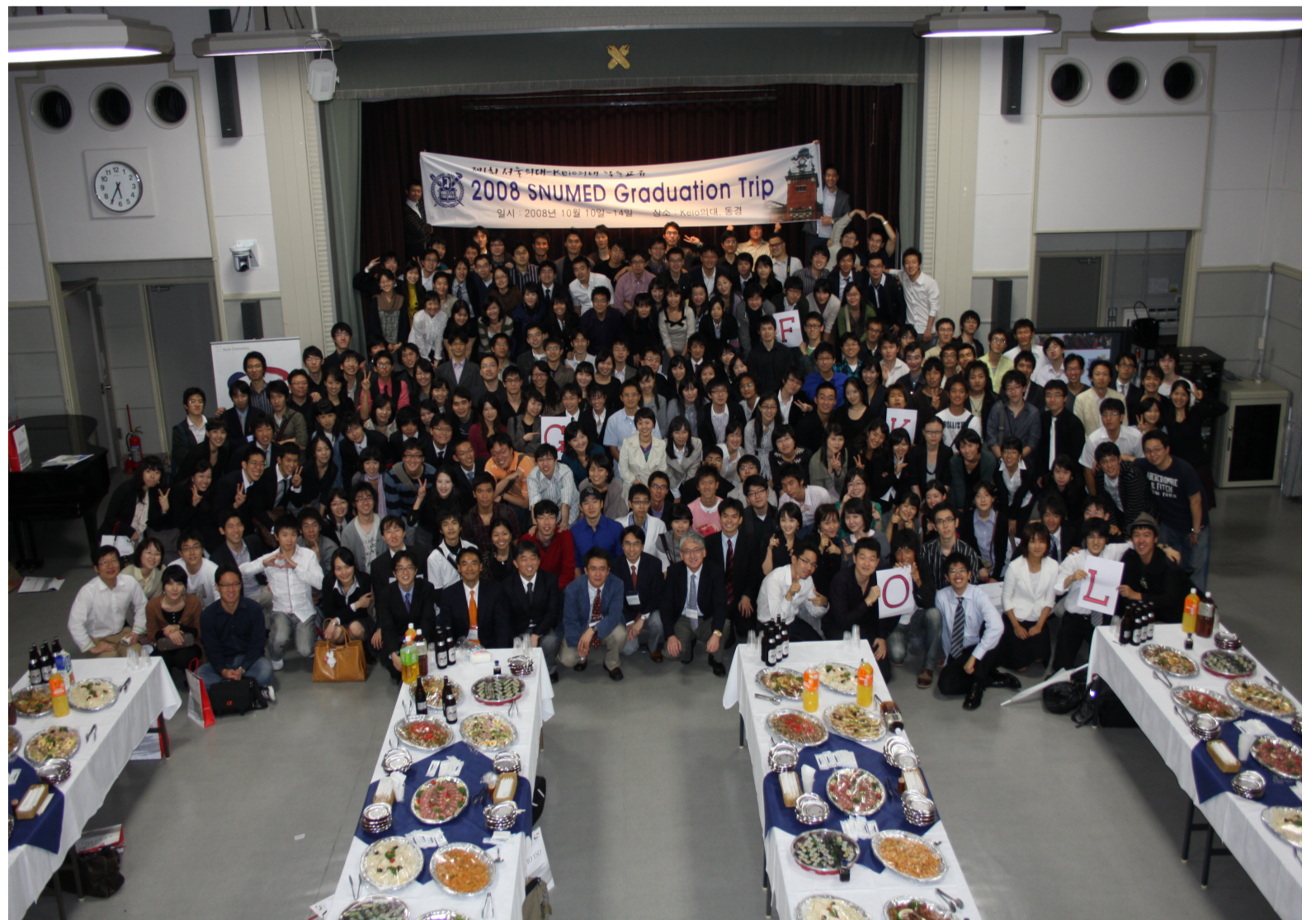
10月11日 ソウル大学医学部 卒業旅行 訪問団受け入れ