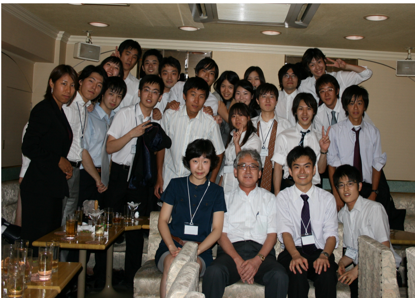
7月 日韓医学生学術交流会の活動 延世大学訪問団 受け入れ

2008年度の本プログラムにおいては、中国および韓国との交流を活発に行いました。北京大学とは、相互に訪問し、交流継続の意思を確認することができました。中国訪問、延世大学およびソウル大学との交流などの学生主体の活動については、未来先導基金のサポートにより、より充実した内容で実現することができました。個々の活動に刺激を受けた学生が、将来に向けてグローバル感覚を身に付けていくものと期待しています。医学部としても、優秀な人材との交流をますます活発化し、アジアのリーダーとして、医学・医療の発展を牽引したいと考えています。