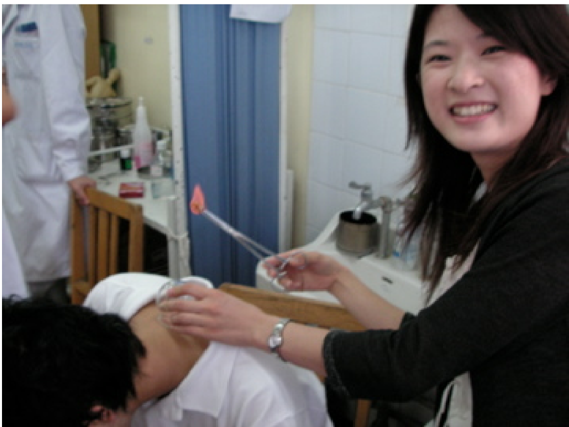
7月 日中医学生交流協会の活動 中国訪問